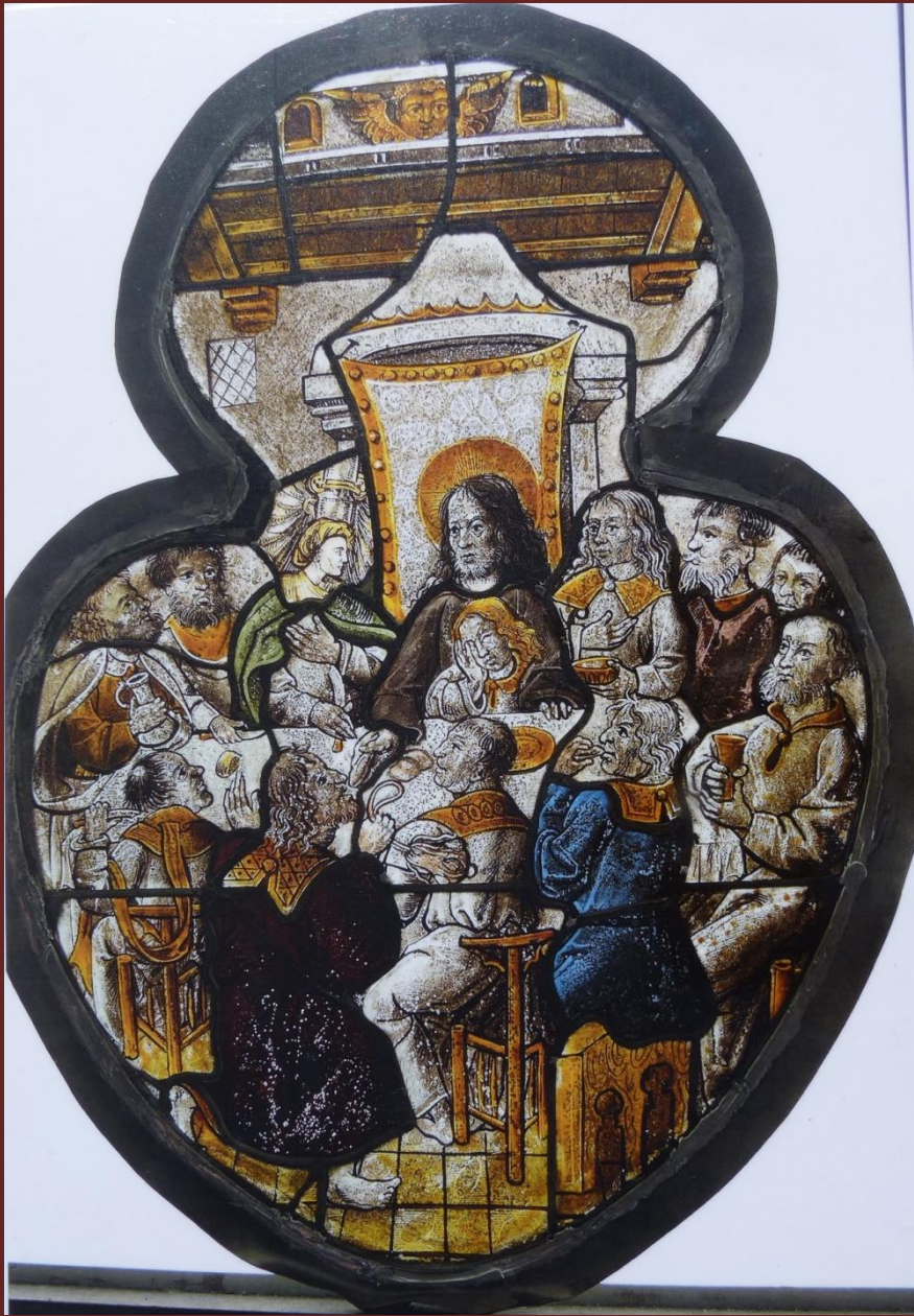
Het Laatste Avondmaal