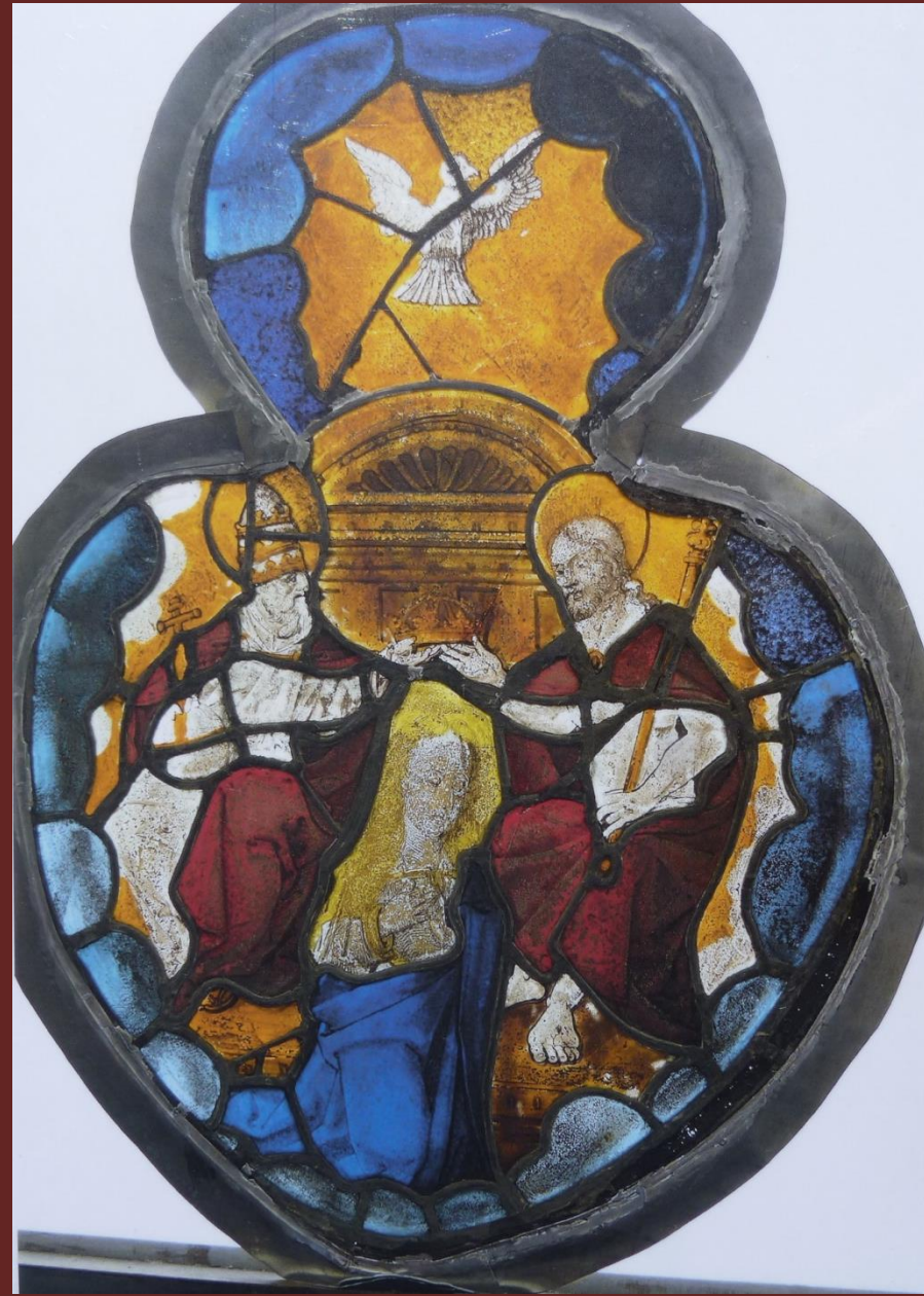
De kroning van Maria tot koningin van hemel en aarde.