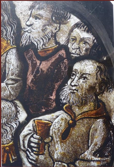
Details van het glasraam links in het hoogkoor, voorstellend het Laatste Avondmaal.

Geniet mee van deze meesterwerkjes, gemaakt door glazeniers 500 jaar geleden.